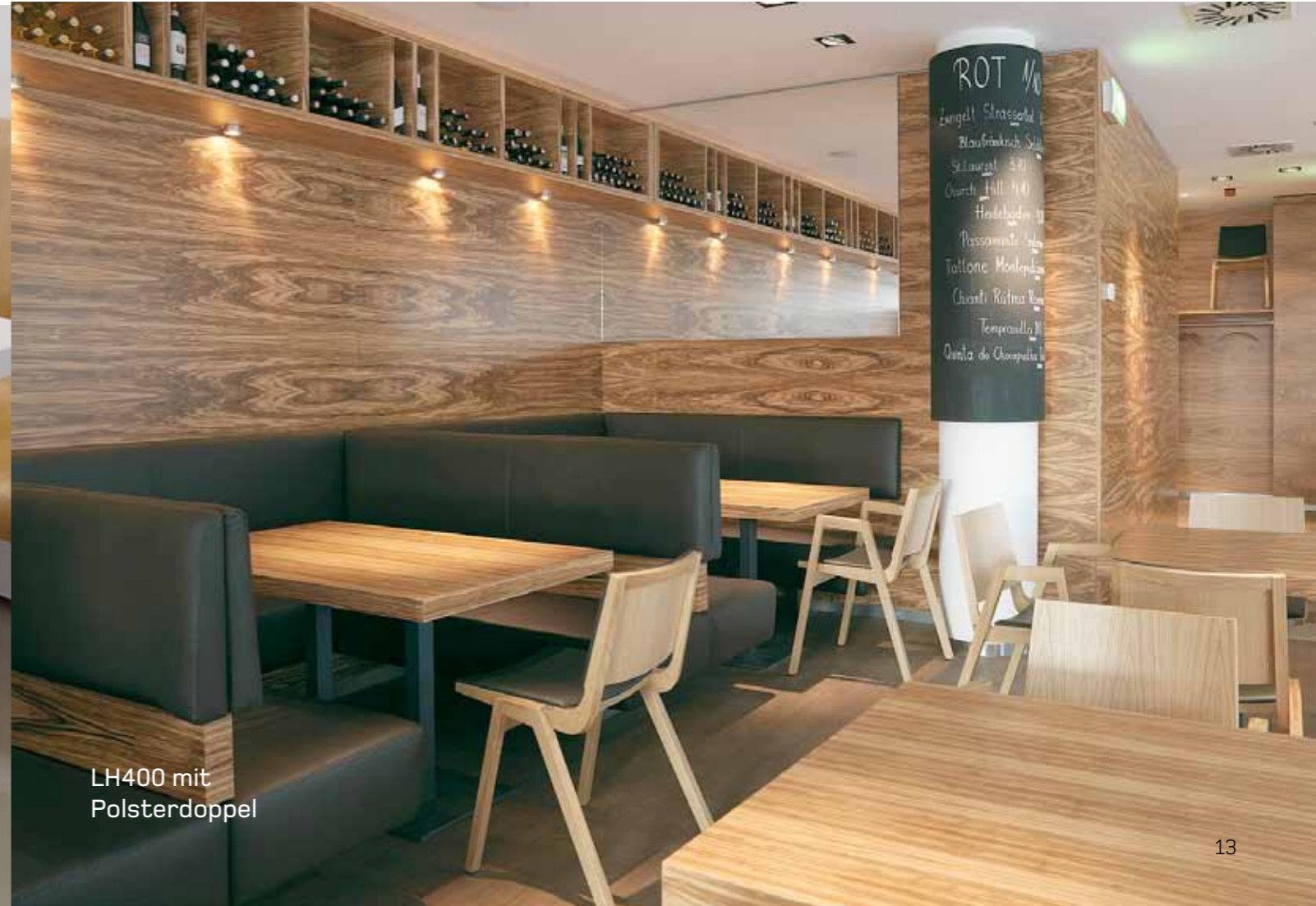
LH400 mit Polsterdoppel