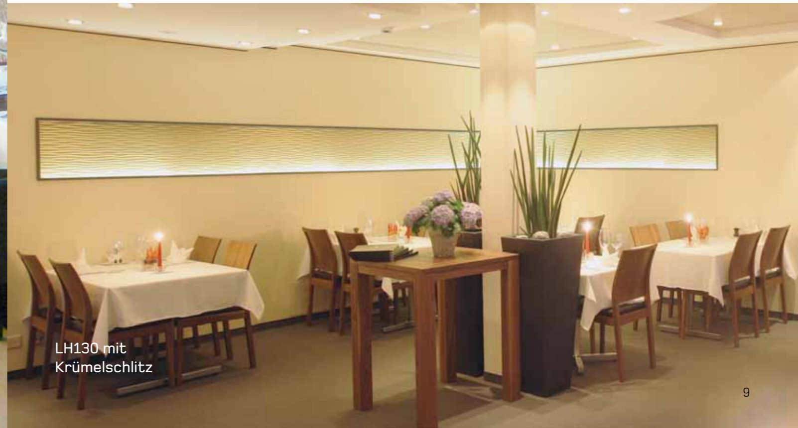
LH130 mit Krümelschlitz

Ob es das Highlight eines Urlaubs ist oder ein regelmäßiges Treffen mit guten Freunden: Man erinnert sich gern und kommt gern wieder.