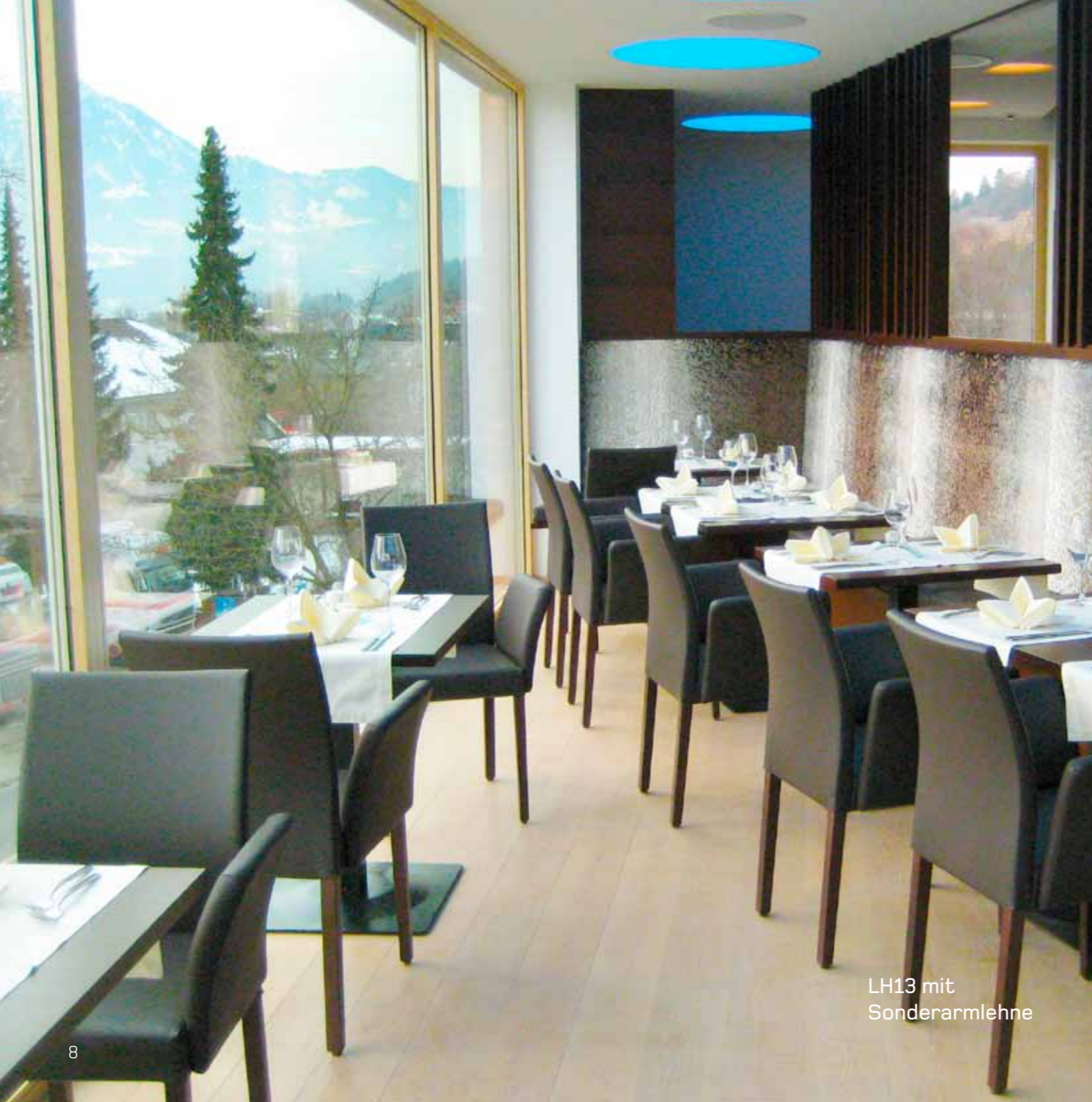
LH13 mit Sonderarmlehne